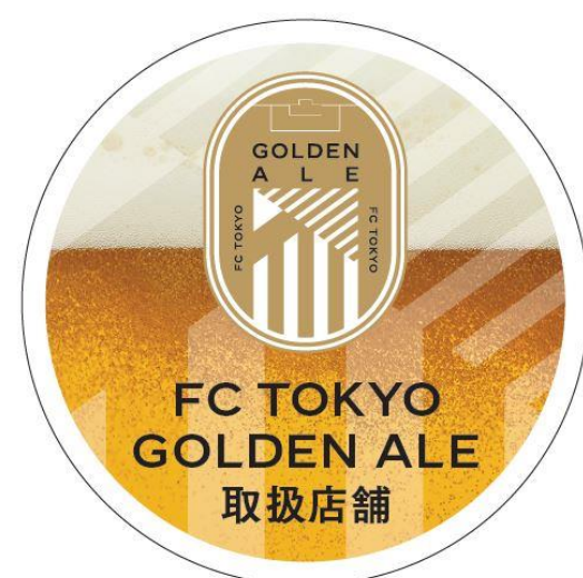
※ステッカー仮デザイン