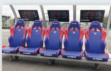
A AK Racing ベンチ型フォトスポット