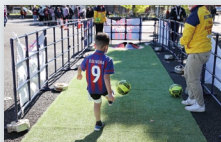
G シューティングゴルフ ※13:00頃(予定)～