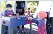
F FC東京スペシャル サッカー盤