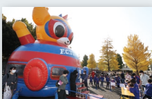
C 東京ドロンパふわふわ