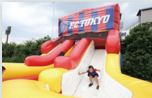
E ダブルスライダー