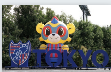
B フォトスポット (ドロンバエアパルーン)