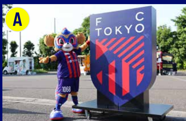
エンブレムモニュメント