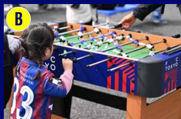
FC東京 スペシャルサッカー盤