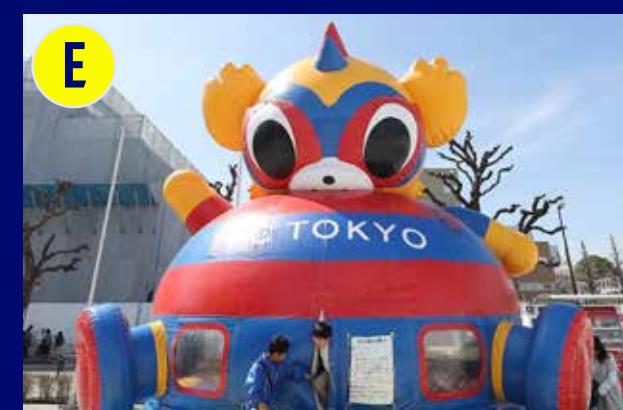
東京ドロンパふわふわ