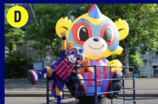
東京ドロンパ エアハルーン