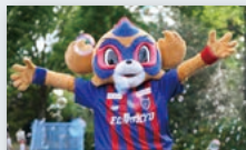
E パパルマシーン ※雨天中止