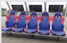
A AK Racing ペンチ型フォトスポット