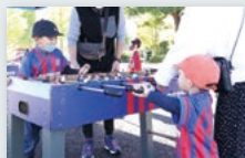
B FC東京スペシャル サッカー盤 ※雨天中止