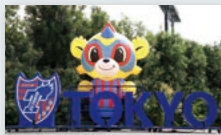
D フォトスポット (東京ドロンパエリアホール＆ TOKYOモニュメント) ※雨天中止