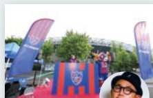
C DJブース (DJ SHUNSUKE)